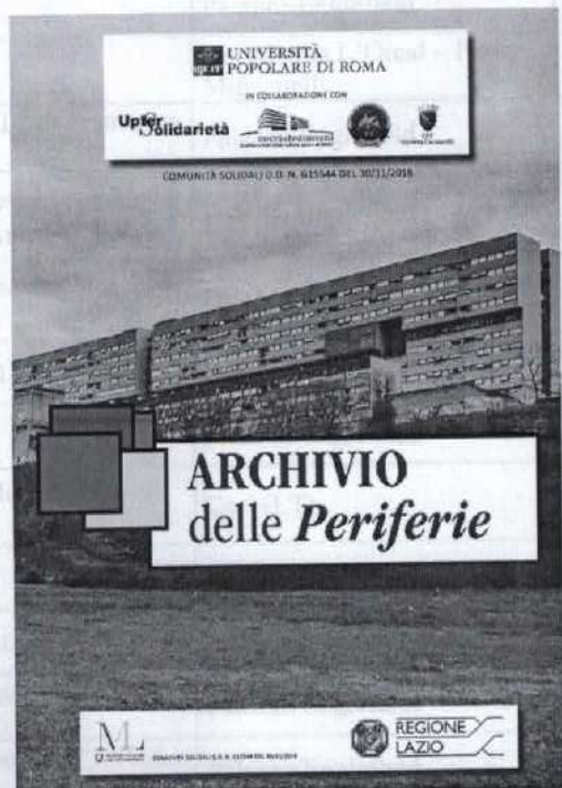
La brochure del progetto.

1.1 Archivio delle Periferie. Il coinvolgimento degli studenti del Liceo Keplero di Roma e del Centro di Formazione Professionale del Comune di Roma "Nicoletta Campanella" di Corviale ha gettato le basi per una futura collaborazione con un territorio in fase di rigenerazione urbana e sociale. Hanno collaborato con noi l'Associazione Corviale Domani e l'Upter Solidarietà. Il progetto è visibile attraverso la piattaforma Instagram alla pagina dedicata.